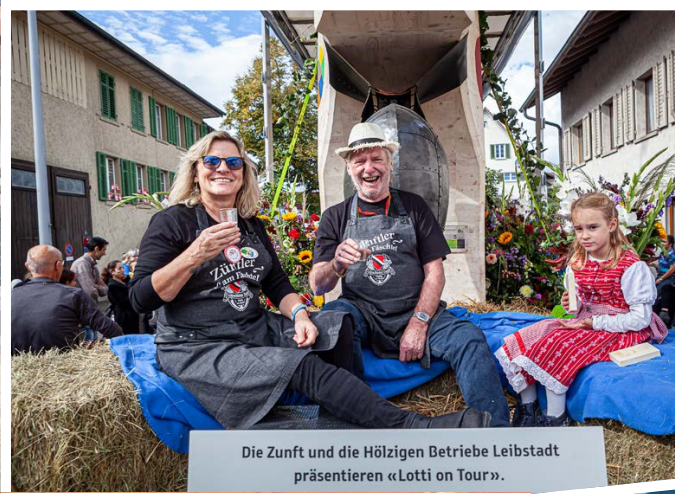
Die Zunft und die Hölzigen Betriebe Leibstadt präsentieren «Lotti on Tour».